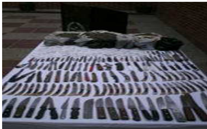
Armas incautadas en operativos policiales en Bogotá